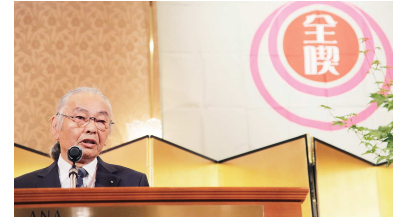
主管 京都府浅沼理事長挨拶