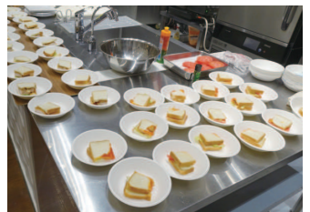
冷凍パンのアレンジメニュー