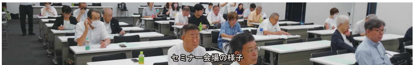
セミナー会場の様子