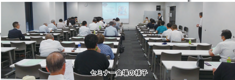
セミナー会場の様子